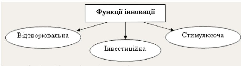
Рисунок 1 – Функції інноваційної діяльності підприємства

Проблемі інноваційної діяльності підприємства приділяли увагу як зарубіжні, так і вітчизняні вчені. Серед зарубіжних вчених основу складають роботи таких авторів, як Друкер П., Й. Шумпетер, Б. Санто, Б. Твісс і ін. Серед вітчизняних наукових праць особливе значення мають роботи П.М. Завліна Н.І., Лапіна, А.А. Тріфілової, В.Д. Грибова, Р.А. Фатхутдінова, і ін. Також варто відзначити, що не тільки вчені досліджують дане питання, але і держава зацікавлена в розвитку інноваційної діяльності. Підтверджує цей факт те, що в нашій країні прийняті державні програми, концепції розвитку інноваційної діяльності [2,3]. Однак, існує цілий ряд проблем і завдань, які до цього моменту не отримали певного вирішення.